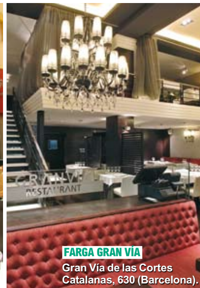
FARGA GRAN VÍA Gran Vía de las Cortes Catalanas, 630 (Barcelona).