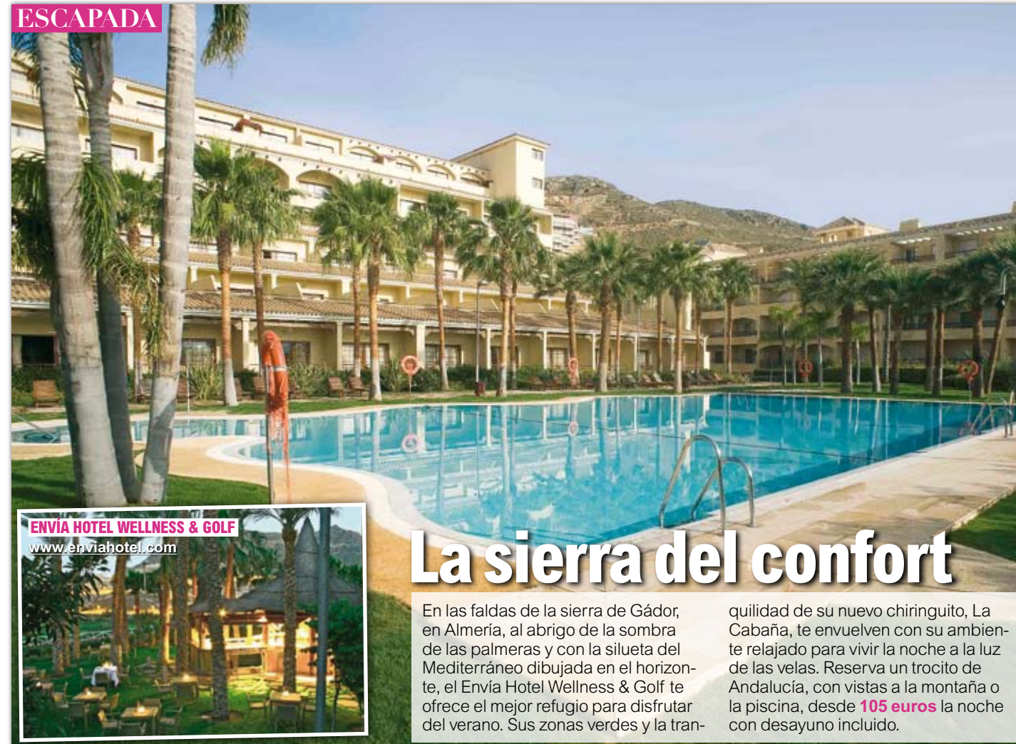
ENVÍA HOTEL WELLNESS & GOLF www.enviahotel.com