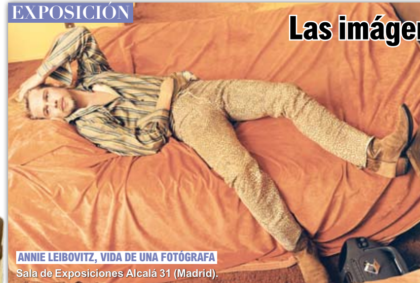
ANNIE LEIBOVITZ, VIDA DE UNA FOTÓGRAFA Sala de Exposiciones Alcalá 31 (Madrid).

Más de 200 fotos componen el recorrido artístico de la muestra Annie Leibovitz, vida de una fotógrafa . 1990-2005, que organiza la Comunidad de Madrid. La exposición, de entrada gratuita, ofrece fotografías de su vida y retratos de famosos. Puede visitarse hasta el 6 de septiembre.